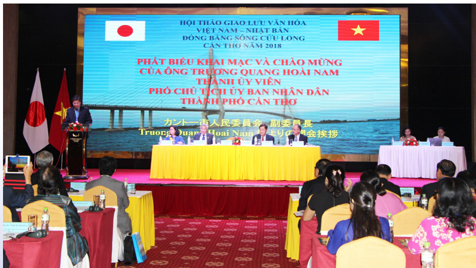
Toàn cảnh Hội thảo khoa học quốc tế “Giao lưu văn hóa Việt - Nhật ĐBSCL - Cần Thơ” năm 2018.

Nhằm trong chuỗi sự kiện kỷ niệm 45 năm ngày thiết lập quan hệ ngoại giao Việt Nam-Nhật Bản (21/9/1973 - 21/9/2018) và Chương trình giao lưu văn hóa thương mại Việt Nam-Nhật Bản lần thứ 4 tại thành phố Cần Thơ, ngày 03/11/2018, Hội thảo khoa học quốc tế “Giao lưu văn hóa Việt-Nhật ĐBSCL-Cần Thơ” năm 2018 được tổ chức dưới sự phối hợp của Trường ĐHCT, Trường Đại học Khoa học Xã hội Nhân văn-Đại học Quốc gia thành phố Hồ Chí Minh và Liên hiệp các tổ chức hữu nghị thành phố Cần Thơ.