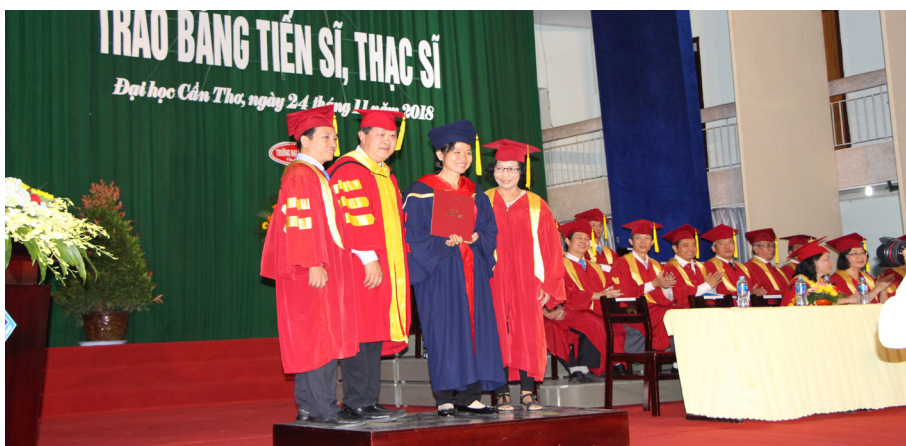
Các tân Tiến sĩ nhận bằng tốt nghiệp và chụp ảnh lưu niệm cùng Hiệu trưởng và cán bộ hướng dẫn.

ngành bậc tiến sĩ. Trường không ngừng cải tiến, nâng cao chất lượng đào tạo theo tiêu chuẩn quốc gia và quốc tế, đặc biệt là tiêu chuẩn AUN-QA, ABET, JBET. Đặc biệt, Trường đã có 05 chương trình đào tạo đại học được công nhận đạt chuẩn AUN-QA gồm: Kinh tế nông nghiệp được AUN công nhận năm 2013, Công nghệ sinh học và Nuôi trồng thủy sản (hai chương trình Tiên tiến) được công nhận năm 2014, Kinh doanh quốc tế và Công nghệ thông tin được công nhận năm 2018. Trường cũng đã tiến hành đánh giá ngoài chất lượng Nhà trường theo tiêu chuẩn của Bộ Giáo dục và Đào tạo vào tháng 12 năm 2017 và được cấp chứng nhận kiểm định chất lượng giai đoạn 2018 - 2023. Những kết quả này đã cùng khẳng định chất lượng giáo dục của Trường ĐHCT, góp phần quan trọng nâng cao vị thế của Nhà trường, xứng đáng là trường đại học trọng điểm của quốc gia.