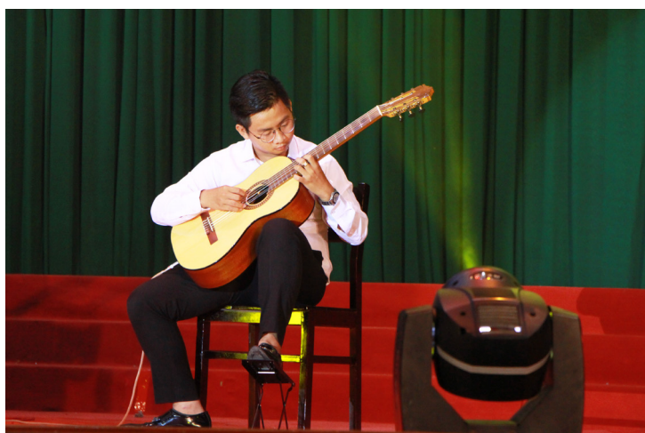
Tiết mục độc tấu dự thi thể loại tài năng nghệ thuật.

Hội thi Tiếng hát, Tài năng nghệ thuật ĐHCT được tổ chức lần đầu tiên vào năm 1992 và đã trở thành Hội thi truyền thống của trường. Quy mô hội thi tăng dần, từ những năm đầu chỉ có thể loại thi hát Quốc ca và đơn ca. Đến nay, trải qua 26 lần tổ chức, Hội thi đã nhận được sự tham gia nhiệt tình của cán bộ, viên chức và sinh viên với đa dạng các loại hình nghệ thuật