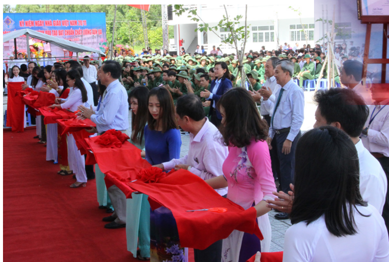
Các đại biểu cắt băng khánh thành công trình nhà học tại Khu Hòa An gồm 12 phòng học, hội trường và một số phòng chức năng với kinh phí đầu tư xây dựng hơn 29 tỉ đồng.

quy mô đào tạo, đưa giáo dục đại học đến gần hơn với nông thôn, Trường ĐHCT quyết định tổ chức đào tạo tại Khu Hòa An. Đến nay Khu Hòa An đã trở thành một nơi đào tạo quan trọng của Trường với 11 ngành đào tạo chuyên biệt cho vùng nông thôn. Khu Hòa An cũng là nơi chủ trì thực hiện các hoạt động nghiên cứu khoa học để giải quyết các vấn đề thực tiễn đặt ra góp phần phát triển nông thôn bền vững tại Hậu Giang cũng như vùng ĐBSCL. Đạt được thành quả trên, ngoài nỗ lực của nhà Trường thì sự ủng hộ của địa phương là rất quan trọng