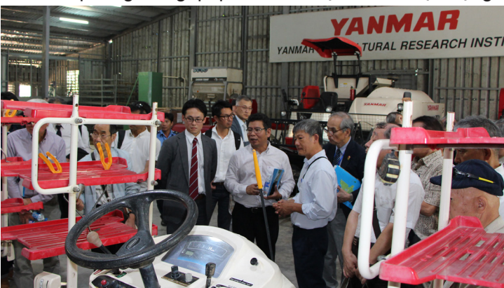
Các đại biểu nghe giới thiệu về máy nông nghiệp được nghiên cứu cải tiến tại Trường ĐHCT và áp dụng hiệu quả ở vùng ĐBSCL.

Khai trương Văn phòng Trung tâm Nghiên cứu đổi mới khoa học công nghệ tiên tiến là một hoạt động trong chuỗi sự kiện Kỷ niệm 45 năm thiết lập quan hệ ngoại giao Việt Nam-Nhật Bản (1973-2018) và Chương trình giao lưu văn hóa và thương mại Việt Nam-Nhật Bản lần thứ 4 tại thành phố Cần Thơ. Do đó, buổi lễ đã thu hút nhiều đại diện doanh nghiệp đến từ Nhật Bản tham dự. Sau buổi lễ, các đại biểu đã đi thăm Phòng thí nghiệm, Viện Nghiên cứu Nông nghiệp Yanmar tại Trường ĐHCT. Đây là mô hình gắn kết giữa trường đại học với doanh nghiệp, đặc biệt là doanh nghiệp nước ngoài, trong nghiên cứu khoa học và đào tạo nguồn nhân lực, đã được Trường triển khai có hiệu quả trong thời gian qua.