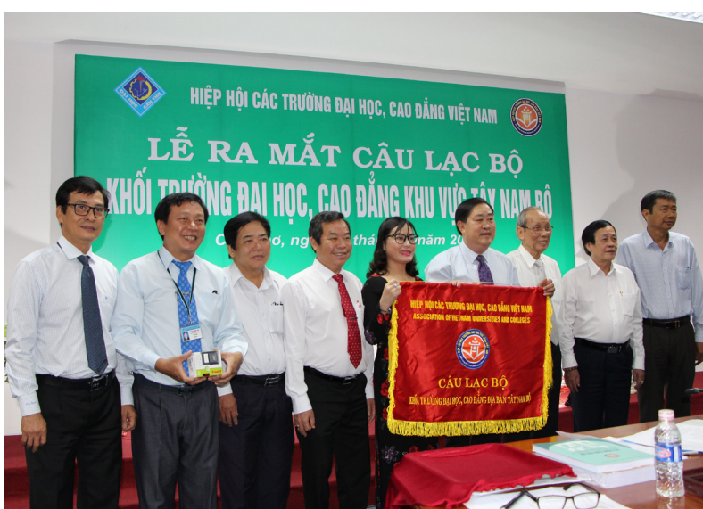
Ban Chủ nhiệm Câu lạc bộ ra mắt.

Với mong muốn phát huy lợi thế của vùng, đẩy mạnh hợp tác, hỗ trợ nhau trong các hoạt động học thuật, góp phần nâng cao năng lực tự chủ đại học và xây dựng Hiệp hội, Câu lạc bộ Khối trường đại học, cao đẳng khu vực Tây Nam Bộ được kỳ vọng sẽ là nơi tập hợp sức mạnh trí tuệ; nơi tổng hợp các nhu cầu, đề xuất của các trường đại học, cao đẳng trong vùng đến các cấp quản lý; đồng thời là nơi trao đổi kinh nghiệm hoạt động, chia sẻ nguồn lực, hợp tác đào tạo, nghiên cứu khoa học, chuyển giao công nghệ, hình thành các cộng đồng tự nguyện liên kết trong công tác tuyển sinh, phát triển chương trình, giáo trình, tài liệu chuyên môn, tổ chức giao lưu phong trào văn nghệ, thể dục thể thao giữa các trường... phát huy tốt ảnh hưởng của các trường có lợi thế, hỗ trợ các trường còn khó khăn, đóng góp có hiệu quả cho sự phát triển của các trường thành viên nói riêng và của vùng ĐBSCL nói chung.