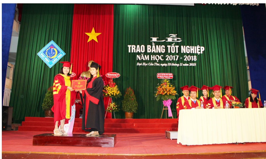
Phó Hiệu trưởng trao bằng tốt nghiệp cho các tân cử nhân và kỹ sư.

Nhằm động viên khích lệ các sinh viên đã có nhiều nỗ lực, cố gắng trong quá trình học tập và rèn luyện, Hiệu trưởng Trường ĐHCT đã ra Quyết định khen thưởng cho các sinh viên có thành tích cao trong học tập, cũng như có nhiều nỗ lực, cố gắng phấn đấu và rèn luyện trong quá trình học tập.