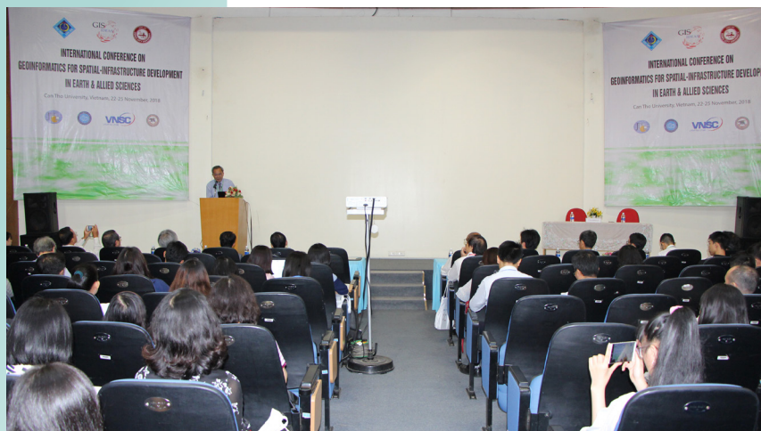
Lễ khai mạc Hội thảo diễn ra tại Trung tâm Học liệu, Trường ĐHCT.

Bên cạnh đó, các tiểu ban báo cáo của Hội thảo tập trung vào các chủ đề: Geo-IoT cho việc