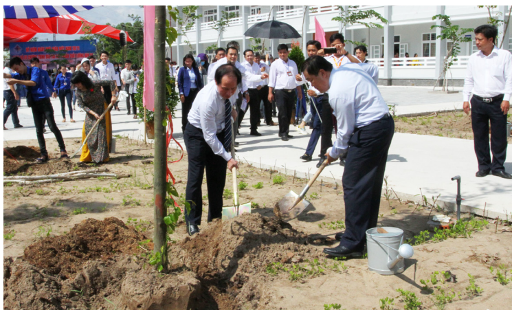
Ban Giám hiệu cùng các đại biểu trồng cây lưu niệm tại Khu Hòa An

và uy tín của Nhà trường đối với xã hội.