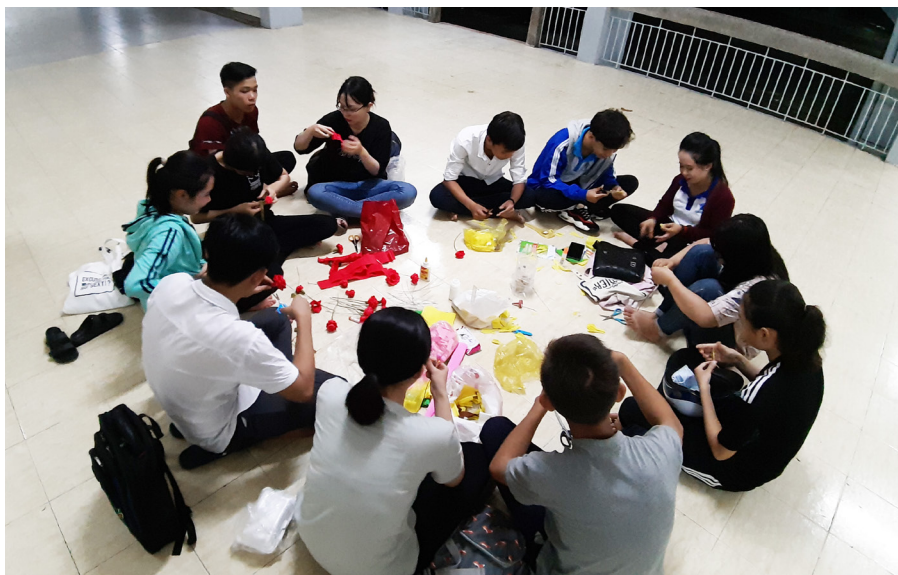
Các bạn sinh viên cùng nhau làm những món quà để gửi về ngôi trường cấp ba của mình.

Một buổi chiều dạo quanh Trường ĐHCT vào những ngày đầu tháng 11, chúng ta không khó để bắt gặp hình ảnh các bạn sinh viên đang cùng nhau làm những món quà để gửi về ngôi trường cấp ba của mình. Món quà của các bạn không cầu kỳ, lấp lánh, cũng không có giá trị về vật chất nhưng chứa đầy tấm lòng của những học trò sau bao năm tháng xa trường, xa thầy. Đôi khi chỉ là một giỏ hoa giấy, đôi khi chỉ là một bức tranh được chính tay các bạn vẽ... nhưng đối với tôi, tất cả đều thật đẹp.