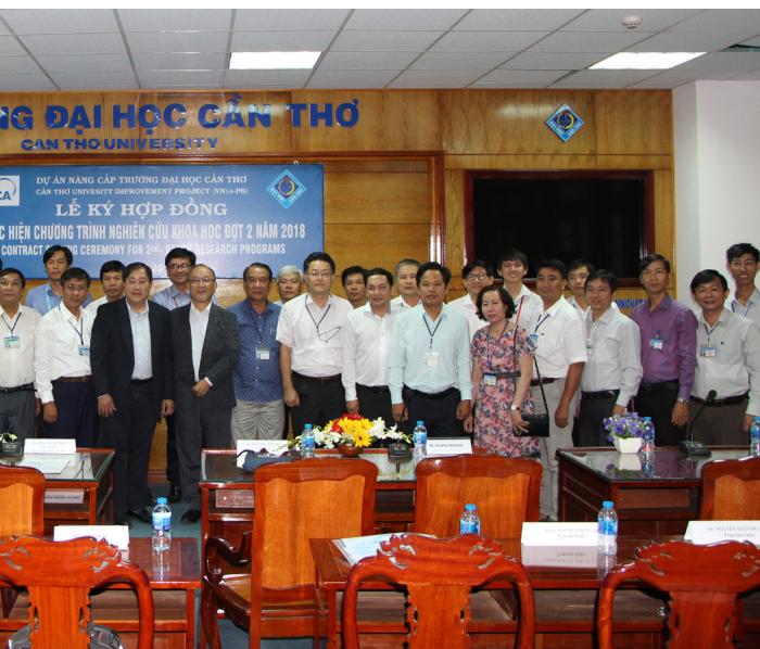
Ảnh lưu niệm tại buổi lễ.

Hiệu trưởng mong muốn các chủ nhiệm đề tài tập trung xây dựng nhóm nghiên cứu, tuân thủ kế hoạch đề ra, phối hợp chặt chẽ với Ban Quản lý Dự án; các phòng, ban chức năng; đặc biệt với các chuyên gia và giáo sư của các trường đại học đối tác phía Nhật Bản để việc thực hiện các đề tài đạt kết quả tốt nhất, từ đó chuyển giao kết quả nghiên cứu về địa phương, tăng cường xuất bản quốc tế, nâng cao chất lượng nguồn nhân lực cũng như chất lượng đào tạo của Nhà trường, góp phần hoàn thành mục tiêu của Dự án.