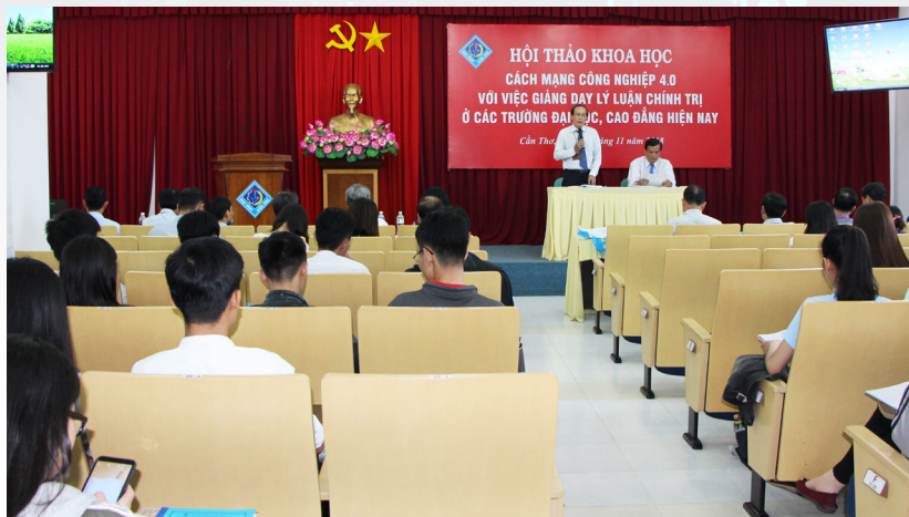
Toàn cảnh Hội thảo khoa học “ Cách mạng công nghiệp 4.0 với việc giảng dạy lý luận chính trị ở các trường đại học, cao đẳng hiện nay ” tại Hội trường 4, Nhà Điều hành, Trường ĐHCT.

Hội thảo khoa học đã thu hút sự quan tâm nghiên cứu và đóng góp bài viết của nhiều nhà khoa học, nhà giáo của các học viện, trường đại học, cao đẳng, trường chính trị và các ban ngành liên quan trong và ngoài vùng ĐBSCL. Nhiều bài viết thể hiện tâm huyết của tác giả, đã phân tích sâu sắc, kiến nghị những cách làm hay, những giải pháp cụ thể nhằm nâng cao hơn