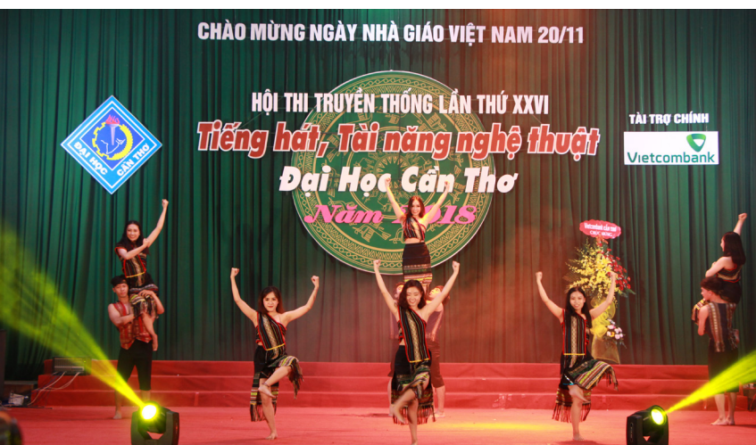
Các tiết mục múa.