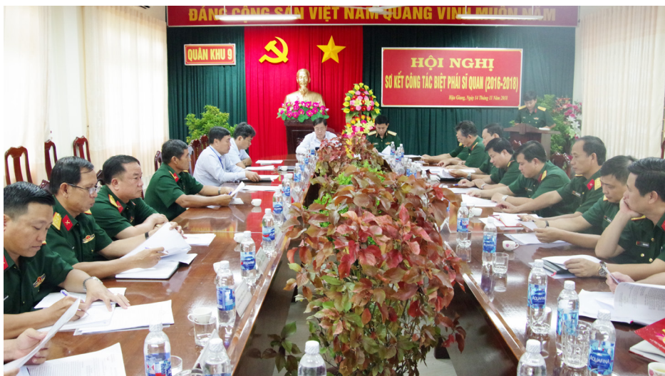
Toàn cảnh Hội nghị tại Trung tâm GDQP&AN, Trường ĐHCĐ.