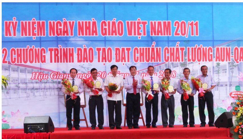
Hiệu trưởng Trường ĐHCT trao biểu trưng đến lãnh đạo tỉnh Hậu Giang qua các thời kỳ, ghi nhận sự đóng góp cũng như mối quan hệ tốt đẹp giữa Nhà trường và tỉnh Hậu Giang.

Hai chương trình tiên tiến Công nghệ sinh học và Nuôi trồng thủy sản của Trường được công nhận đạt chuẩn AUN-QA vào ngày 15/11/2014 đã một lần nữa khẳng định chất lượng đào tạo và hiệu quả đầu ra của hai chương trình này, đồng thời khẳng định mạnh mẽ cam kết của Trường ĐHCT với xã hội về đảm bảo chất lượng