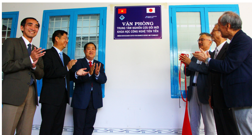
Kéo băng khánh thành Văn phòng Trung tâm.

nghiên cứu khoa học và đào tạo của Trường, mở ra cơ hội hợp tác giữa Trường ĐHCT nói riêng và ĐBSCL nói chung với các đối tác Nhật Bản trong lĩnh vực khoa học công nghệ.